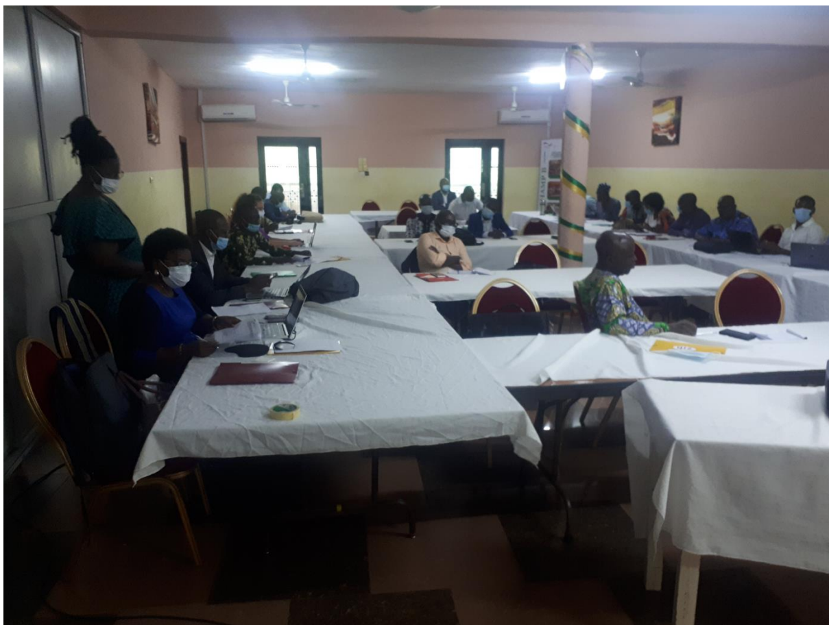
Photo d'ensemble en plénière (un groupe d'acteurs qui se trouvent devant et à droite n'est pas intégré)