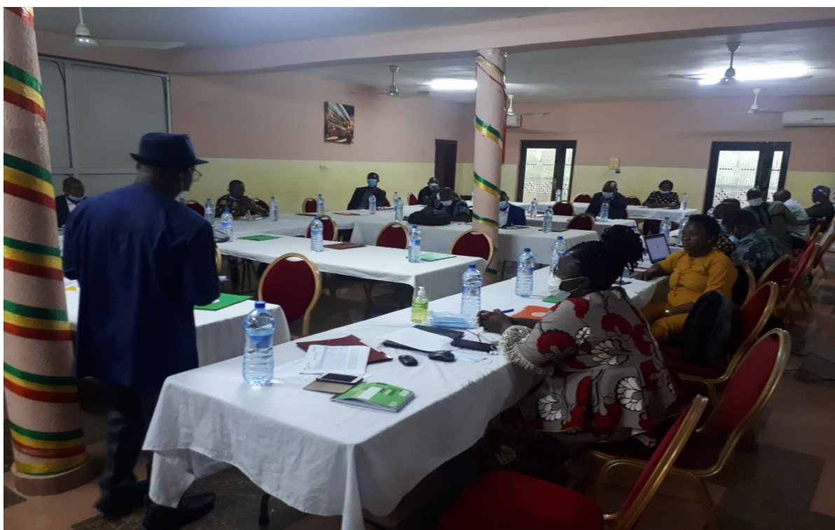
Photo en plénière avec le facilitateur qui communique avec les acteurs