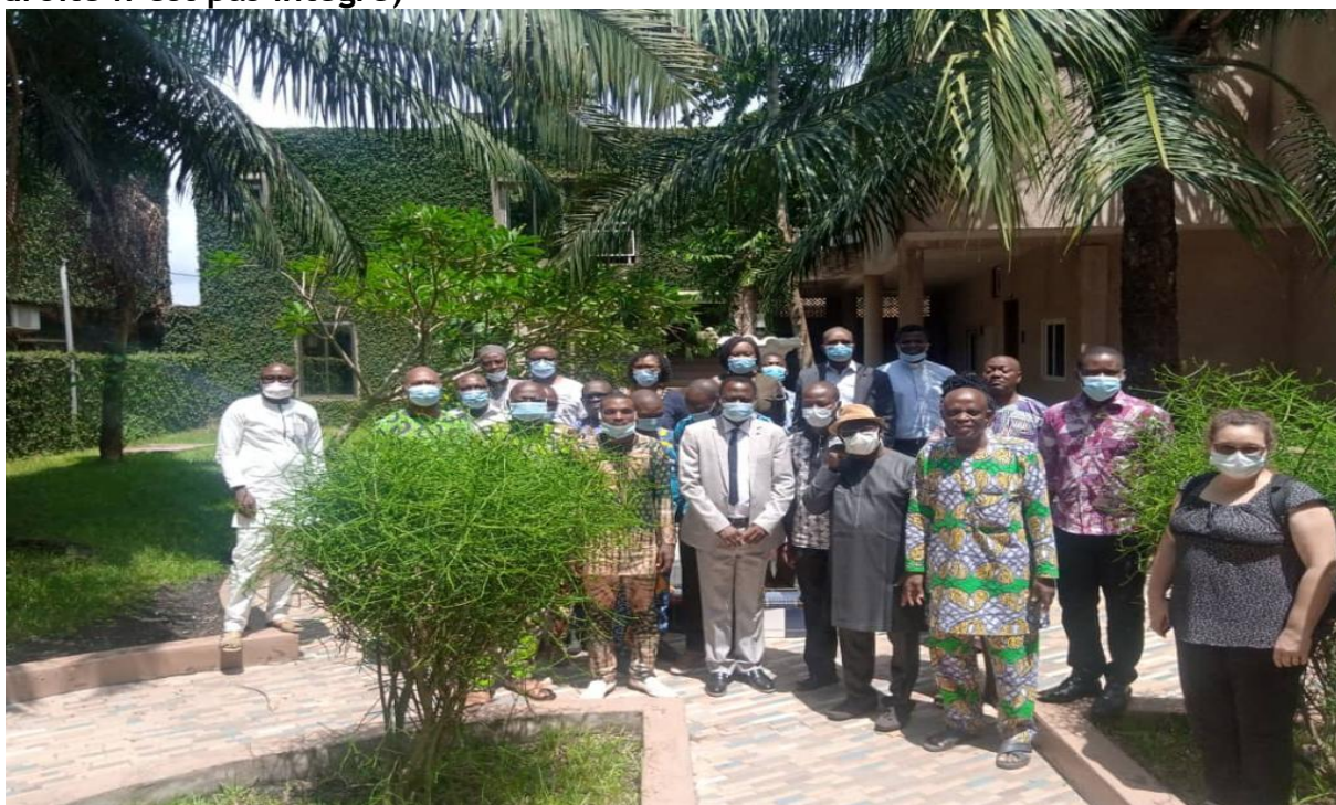
Photo de famille à l'extérieur