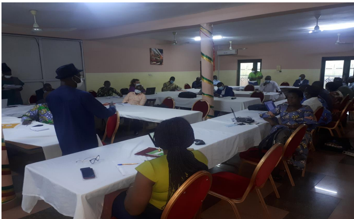
Photo en plénière avec le facilitateur qui communique avec les acteurs