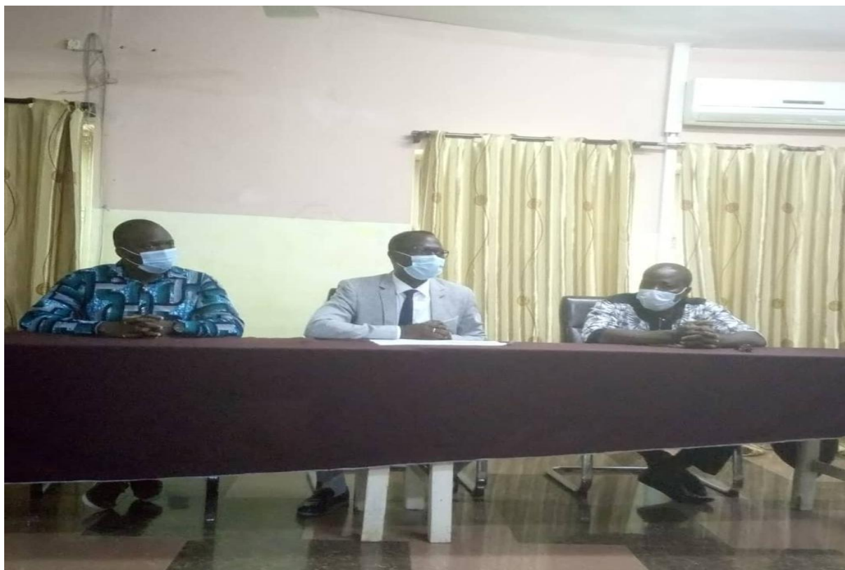
Photo des officiels à la cérémonie du lancement